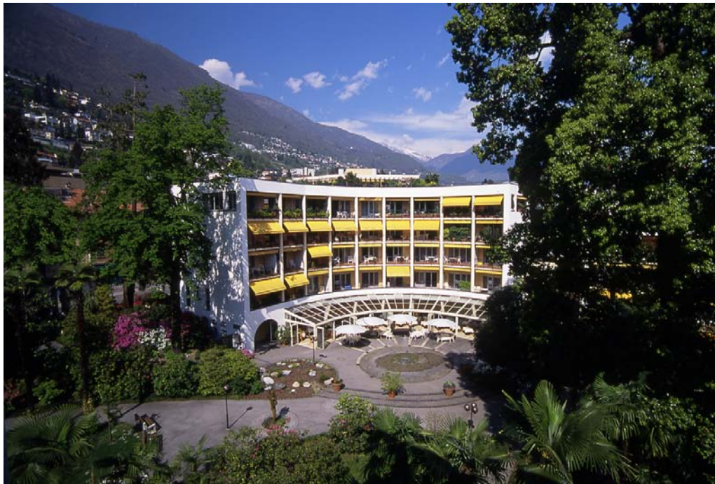
Ristorante "Residenza Al Parco " Locarno-Muralto