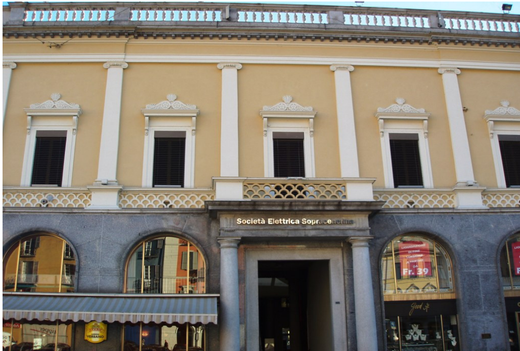
Palazzo della Società Elettrica Sopracenerina Piazza Grande, Locarno